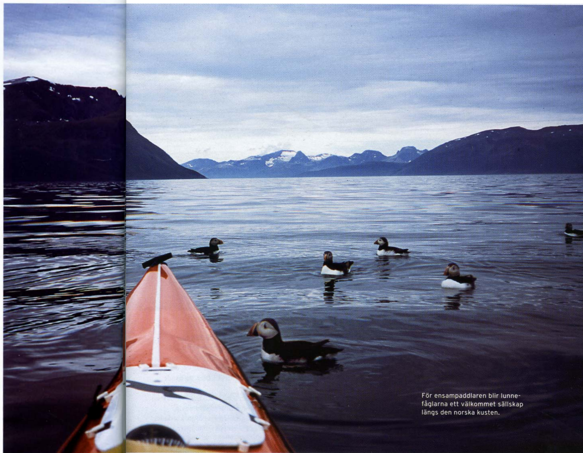
För ensam paddlaren blir lunnefåglarna ett välkommet sällskap längs den norska kusten.

Från den danska kusten satte han sedan av mot Norge och vidare genom sjösystemen i Finland.