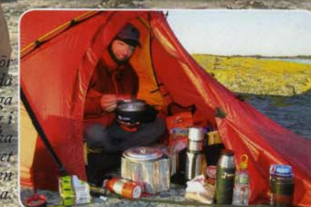
Golv i tältet bör vara i absiden – då slipper man lägga torr utrustning i blött gräs. Torka sedan tältet, golvet och utrustningen med en trasa.