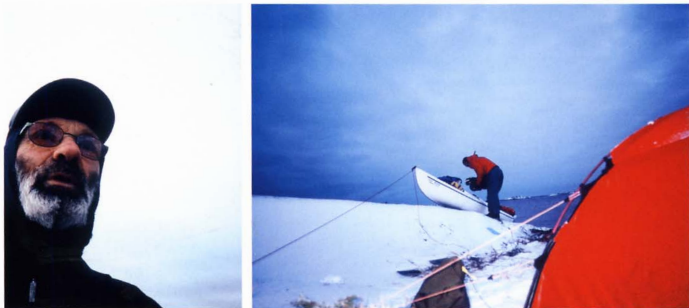
ISFRASSE ÄR PENSIONÄR med en tonårsings kondition. Vinden var så hård att inte bara tältet måste förankras utan också kajaken.