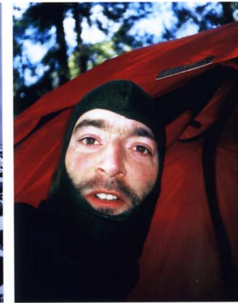
LYGNA DEN 12 februari och jag själv i vintermundering.

Efter ännu en intressant paddling i kyla och hög sjö når vi Lygna/Söderskärgården. I vikarna ligger isflak och vi ser ingen plats där vi kan dra upp kajaken på land.